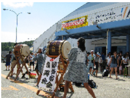
⑨小笠原太鼓 (イメージ)