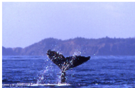
⑫ザトウクジラ② (イメージ)