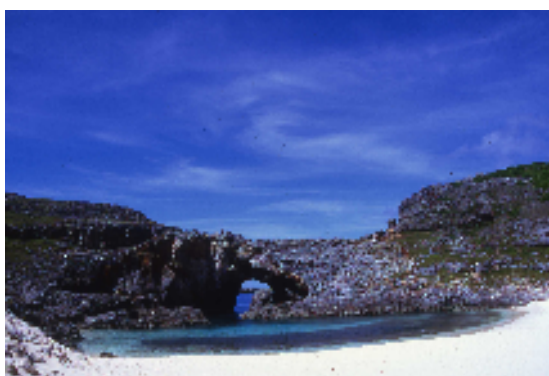
⑭南島・扇池 (イメージ)