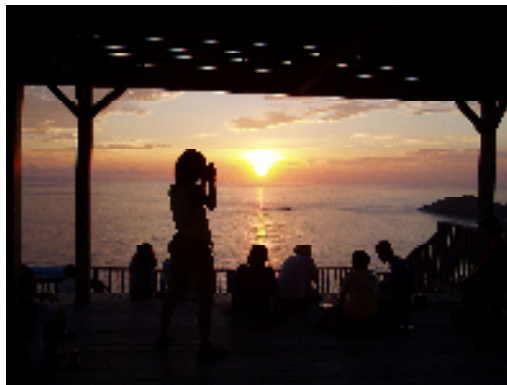
⑧三日月山展望台 (イメージ)