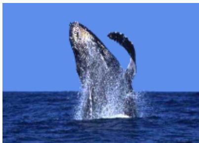
⑪ザトウクジラ① (イメージ)