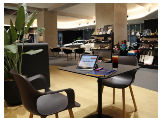
※カフェなどの社外での業務遂行も可能

本サービスを利用することで、社員全員がどこにいても常に情報共有できる環境が整備され、かつダウンロードの手間も省けるため、業務の効率化を図ることができます。