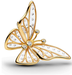
Oversized Butterfly Openwork Charm ¥20,900

14Kゴールドプレーティングで仕上げられたチャームは、あらゆる形の母性を祝福する、存在感のあるワードチャームです。各文字にはクリアキュービックジルコニアがあしらわれ、華やかな輝きを添えています。