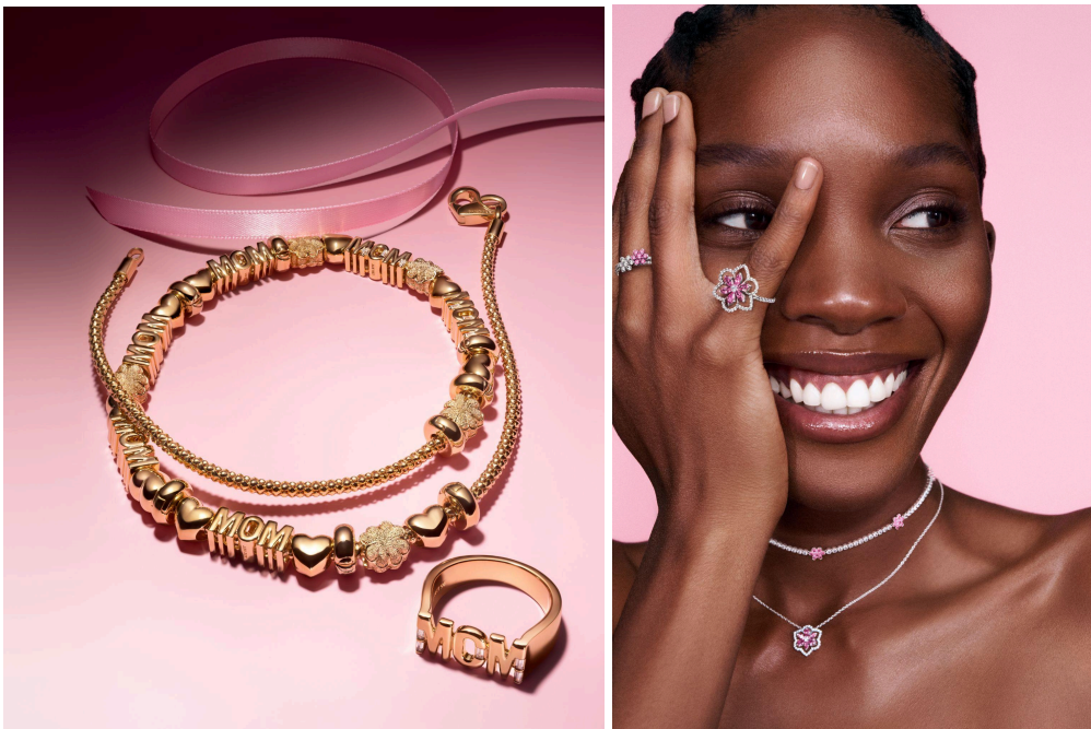
PANDORA(パンドラ) 2026年「Cool Mom」「Garden of Dreams」コレクション