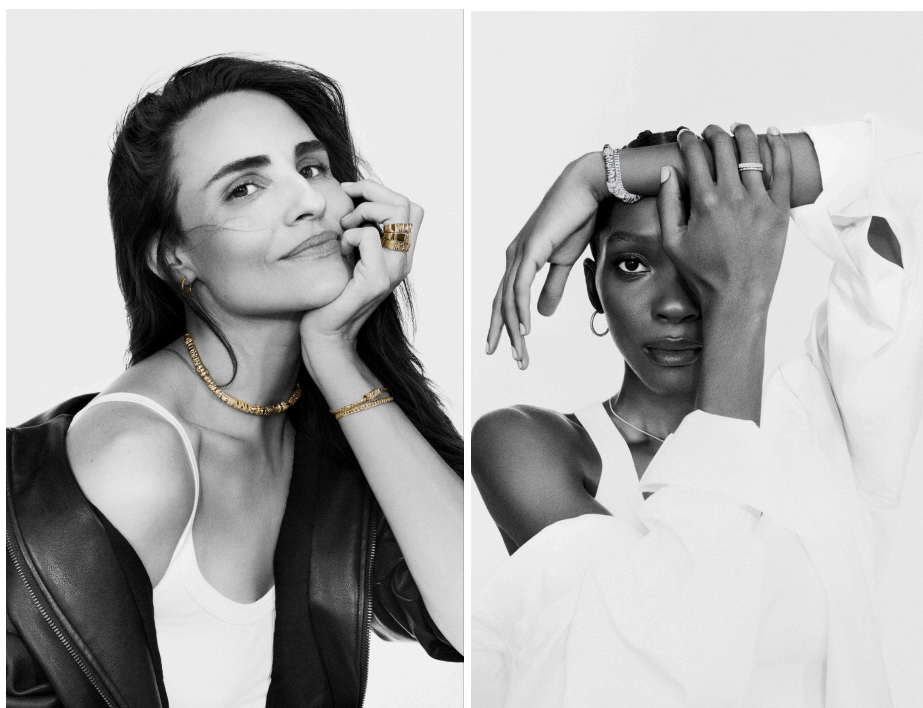
PANDORA(パンドラ) 2026年「Cool Mom」「Garden of Dreams」コレクション

URL : https://jp.pandora.net/ja/gifts/occasions/mothers-da/