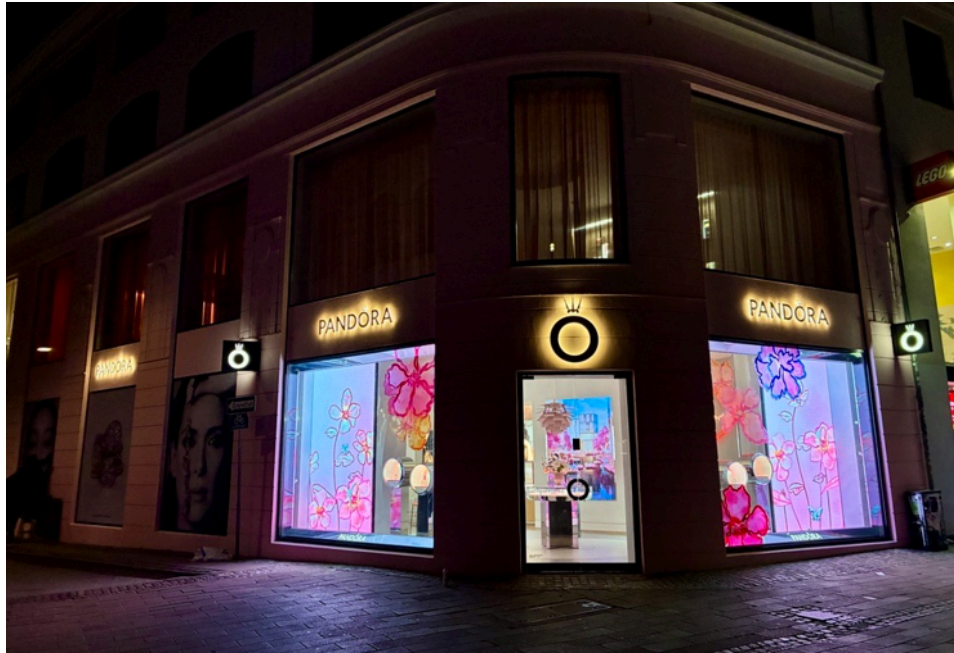
PANDORA 2026年「Cool Mom」「Garden of Dreams」コレクション 外観イメージ