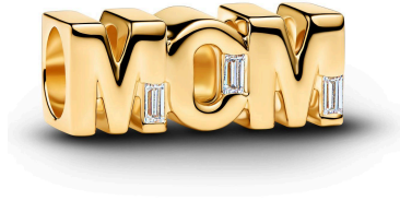
Reversible Mom Charm ¥11,990

ピンクのバイオレジン製マザーオブパールをあしらい、表裏に「mother」「daughter」「I would choose you in every lifetime」の刻印が施されています。