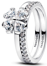
Sparkling Lucky Clover Splitable Ring ¥20,900

スターリングシルバーのリングセットは、パヴェバンドとハート型のストーンをそれぞれあしらったデザインです。