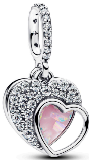
Beautiful Mother Double Dangle Charm ¥12,650

大きく羽ばたく、オーバーサイズのバタフライチャームは、自然が持つ変容の力を象徴するモチーフです。ステンドグラスのように光を透過する特殊なレジンとストーンをあしらい、14Kゴールドプレーティングで仕上げられています。