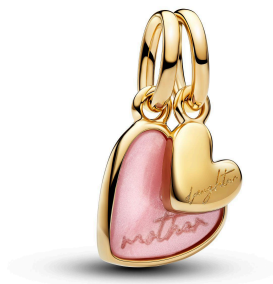
Pink Mother & Daughter Splittable Dangle Charm ¥16,500