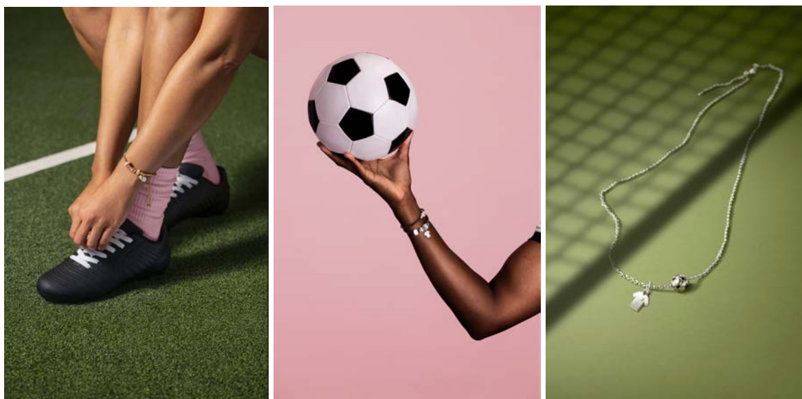
PANDORA (パンドラ) 2026年「Soccer Capsule Collection」

本コレクションは、サッカーを通じて生まれる仲間との絆や高揚感、勝利の喜びを称えるコレクションです。スポーツがもたらす情熱や一体感を、パンドラならではのクラフツマンシップと遊び心あふれるディテールで表現しています。