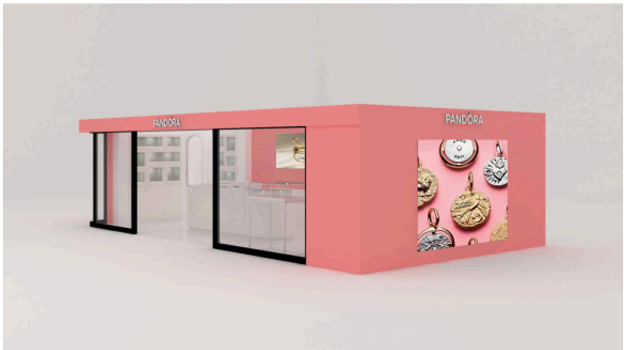
Pandora 阪急大阪梅田駅店 店舗イメージ

ご自身へのご褒美としてはもちろん、友人やパートナーとの思い出をかたちにしたり、ご家族や大切な方へのギフトとしてもお楽しみいただけます。