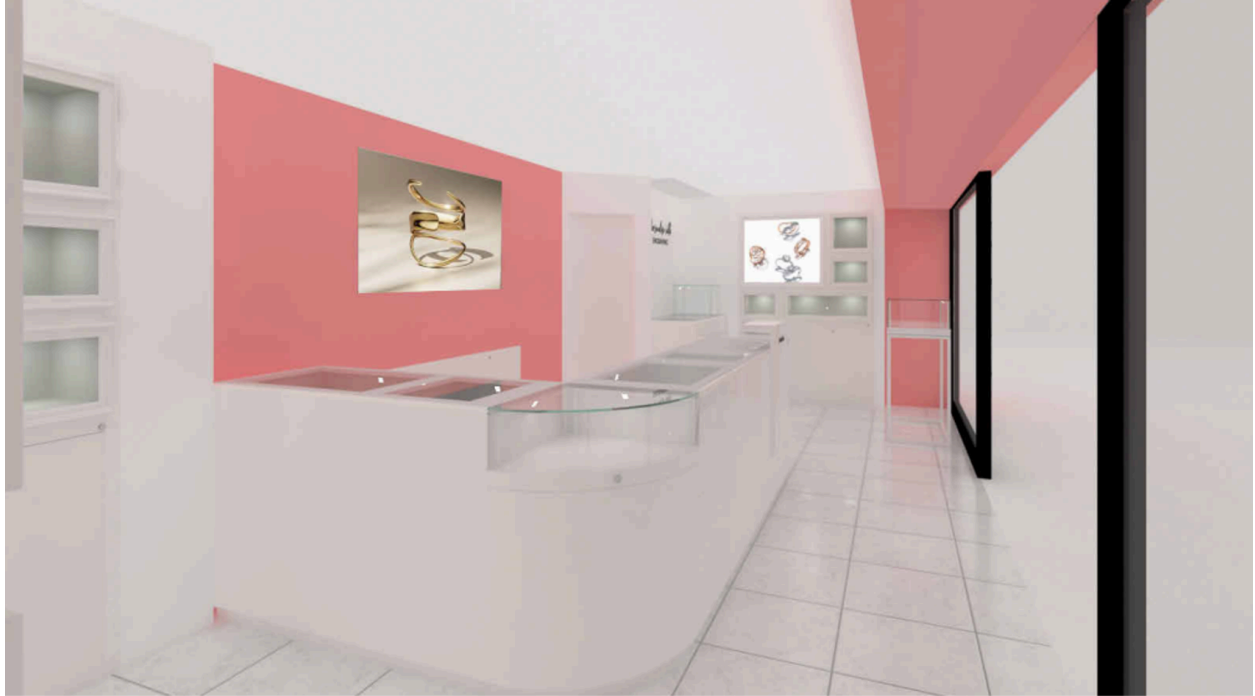
Pandora 阪急大阪梅田駅店 店舗イメージ