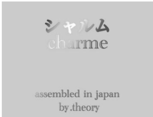
画像 2：初期画面(電源オン時)

8インチタッチパネルのメニュー画面も当社の独自デザインで、直感的に使いやすい洗練されたデザインとし、エステシャンにとっての使いやすさを追求、且つ、お客さまの様々なご要望に応えられるように細かな設定も可能なように工夫を凝らしました。