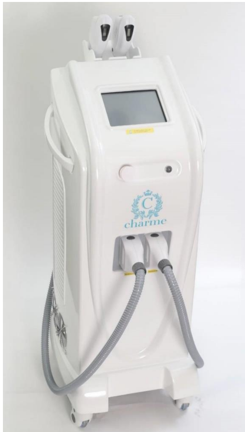
画像1：シャルム本体写真

業界の専門家によると、ここまでハイスペックにしなくても脱毛機としての性能は十分だという意見もありましたが、パワーや冷却装置に十分な余裕を持たせることが、安全・安心な施術を容易にさせ、お客さまの満足度を上げる効果があると信じています。また、最新の「SHRC方式」と独自開発の「フォトDEEP」により、脱毛・美顔・バストアップの1台3役の複合機でもあります。