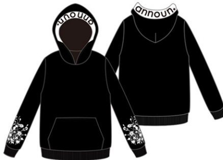
Floralプルオーバーパーカ