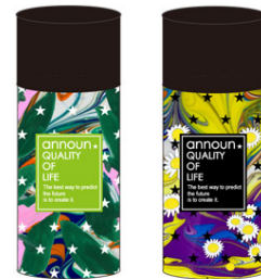
ステンレストンブラー