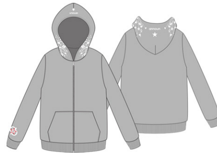
FloralLogoジップアップパーカ