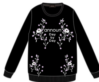
FloralDotクールネックトレーナー