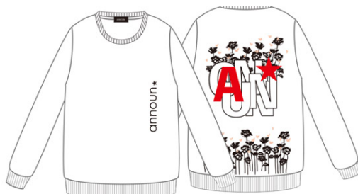
Floralクールネックトレーナー