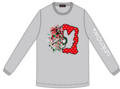
Girl ロングスリーブTシャツ