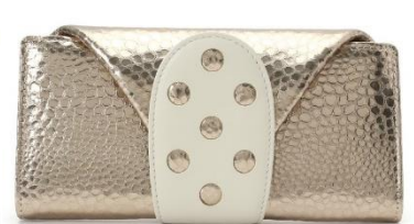
手のひらサイズのミニмумウォレット:munekawa税込 29,700円