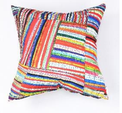
アートクッション カバーのみ 6,380円

【その他出店ブランド】「リッチーエブリデイ」ウガンダの女性の雇用を支えながらアフリカンプリントを使ったバッグなど 「メイグローブ by トライバックス」インドの伝統技術を使ったハンドメイドアクセサリーなど。