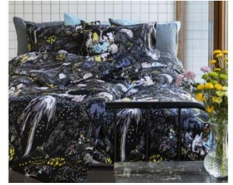
輸入品〈FINLAYSON〉デュベカバーセット 16,280 円

森の中で遊ぶムーミンたちを繊細なタッチでデザイン。食品や小物入れにぴったり。 一般発売日：2月下旬