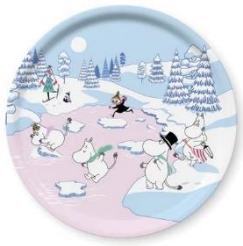
輸入品〈OPTO DESIGN〉ラウンドレイ 4,950 円

美しい冬のムーミン谷で遊ぶムーミン一家を表現したデザイン。 一般発売日：2月下旬