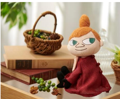
リトルミイ ぬいぐるみ 4,180 円

小説『ムーミン谷の仲間たち』に登場する、前髪をおろしたリトルミイの新作ぬいぐるみが登場！