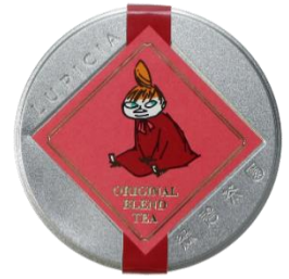
〈LUPICIA〉オリジナルフレーバーティー 1,620 円

繊細に切り出されたリトルミイと、シンプルで上品な配色のアクリルパーツが揺れる、心をくすぐられるアクセサリー。