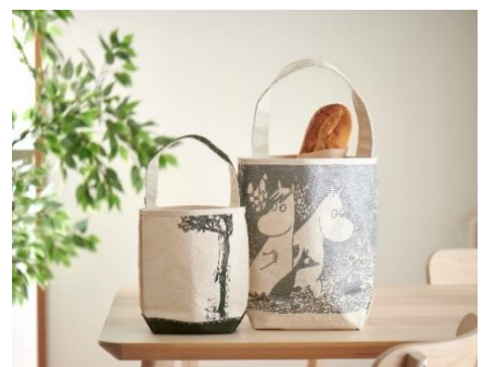
〈TEMBEA〉BAGUETTE TOTE (左)MINI 17,600 円 (右)SMALL 19,800 円

UVカット、防水加工を施した晴雨兼用傘。手染めで仕上げた独特の風合いとムーミンやしきのシルエットを活かした図案は雨の日でも気分を盛り上げます。