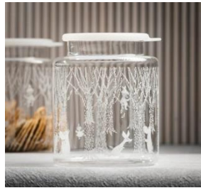
輸入品〈MUURLA〉蓋付きガラスジャー 6,160 円

美しい冬のムーミン谷で遊ぶムーミン一家を表現したデザイン。 一般発売日：2月下旬