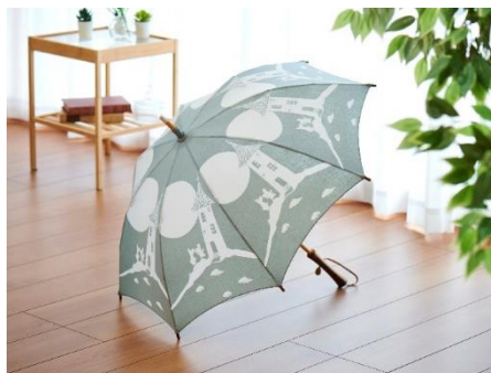
〈breezyblue〉バイカラー捺染パラスル(長傘) 27,500 円

小説『ムーミン谷の仲間たち』に登場する、前髪をおろしたリトルミイの新作ぬいぐるみが登場！