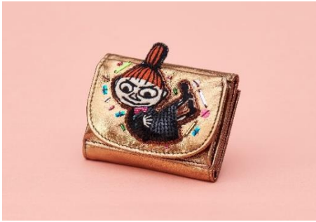
〈tamaoworld〉 ミニ財布 17,600 円