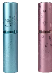
アトマイザー 各 1,980 円

テキスタイルデザイナー鈴木マサル氏が手掛けるブランド、MOOMIN TRIBUTE WORKS の最新作。一般発売日：2月下旬