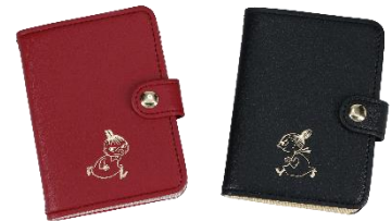
FOIL カードケース 各 2,420 円

香水はもちろんのこと、アルコール消毒液を入れて持ち歩くことができるアトマイザー。