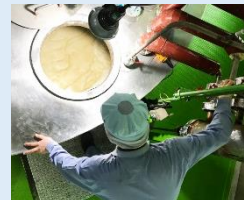
▲目で見るだけでなく、音や匂い、味や手ざわりを確認しながら五感をフルに働かせて、職人が石けんの微妙な変化を調整している

なによりお客様に求めていただいたからこそ苦難を乗り越えることができ、今があります。これからも「健康な体ときれいな水を守る。」という企業理念のもと、人にも自然にもやさしい無添加石けんにこだわり続けます。