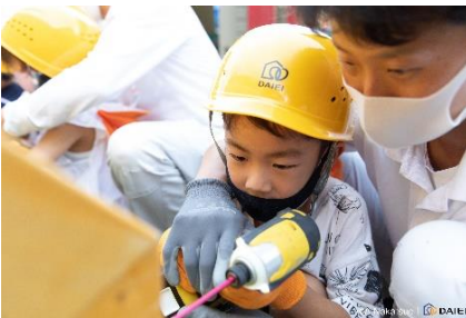
▲出張こども大工の様子

さらなる建築端材の有効活用ならびに正しい手洗いを楽しく啓発し、手洗いを通して水の大切さを考える機会を創出する取り組みとして、地元企業を中心に民間企業6社がタッグを組み、「SuiSui WASH project」を立ち上げました。