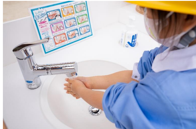
▲実際に子どもが SuiSui リヤタイで手洗いを行う様子