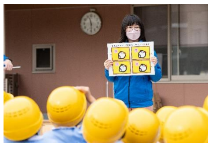
▲手洗い教室の様子