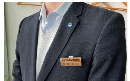
▲アップサイクルしたネームプレート