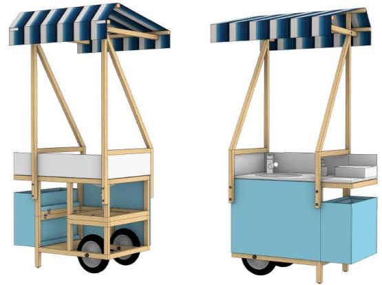
▲建築端材をベースに天幕に小倉織、 タカギ製の洗面用水栓を搭載

パートナーシップが実現した具体的なプロダクトとして、今後各種イベント等で活用するとともに、2023年1月4日(水)より北九州市がSDGs推進のプラットフォームとしてオープンする「北九州SDGsステーション」でも展示いたします。