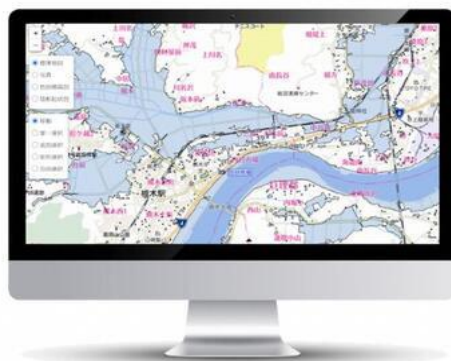
図3：衛星防災情報サービスの「システム画面イメージ」

*1 衛星防災情報サービス：3社は2021年4月より、『衛星防災情報サービス』としてLIANAに加え災害時に衛星データ(光学/SAR)とその解析によって、広域に浸水や土砂崩落といった災害状況を把握するためのサービスも構築中。