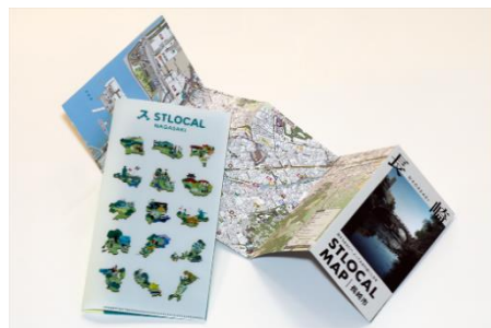
▲無料提供の「STLOCAL MAP 長崎」とオリジナルチケットホルダー