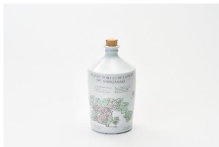
▲出島の古地図をデザインした「コンブラ瓶」