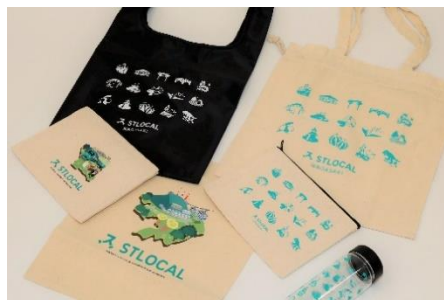
▲マルシェバッグ、トートバッグ等