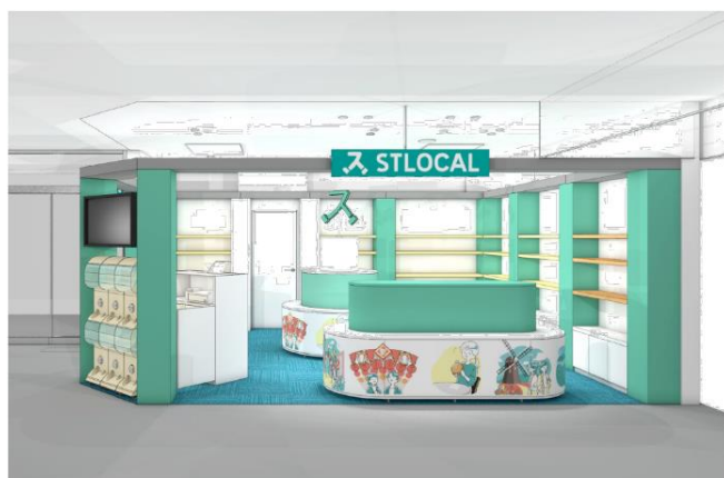
▲ショップ「STLOCAL」外観(長崎駅前店イメージ)