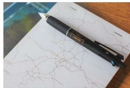
▲ボールペンの側面に、60 万分の 1 縮尺のスケールをデザイン。他のアイテムと合わせて使うことで、距離を測ることも可能な知的好奇心をくすぐるアイテム。