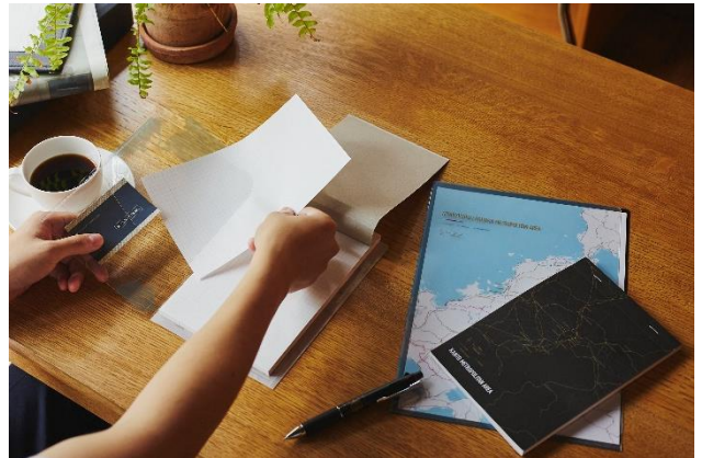
▲「レトロなモノ」と「レトロな場所」をテーマにデザインした「街まちレトロ」ステーショナリー ▲大都市圏の道路網・鉄道網をデザインした「街まち Metropolitan series」