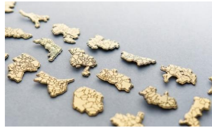
▲47 都道府県すべての市区町村界をデザイン