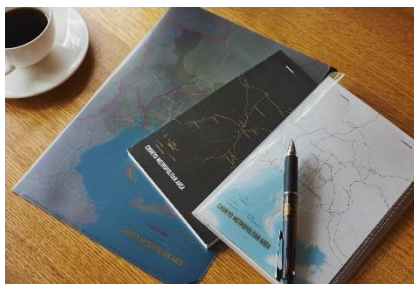
▲各エリアの道路網と鉄道網がデザインされたステーショナリー

大都市圏 (関東、中京、近畿、北九州・福岡) の交通インフラをテーマにした地図デザイン文具。エリアは、人口の多い順番に人気。特に関東・近畿は広範囲にわたって道路網・鉄道網が張りめぐらされている様子がわかります。