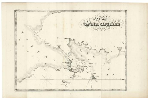
▲シーボルト「VAN DER CAPELLEN」(1852年) オランダ商館医のシーボルトが関門海峡を描いた地図

小倉駅が所在する北九州市は、関門海峡を隔てて本州と向かい合うように位置しています。関門海峡には、古くから九州と本州を行き来するために、航路や鉄道、道路などの様々な「路」が通じていました。江戸時代から現代に至るまでの関門海峡の地図を通して、描かれた「路」の歴史をご紹介します。