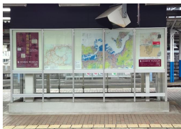
▲5・6番のりばの旧喫煙ルームを活用した展示スペース