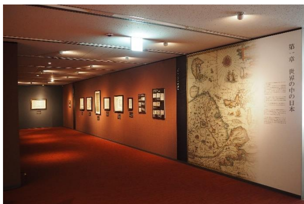
▲第1章 世界の中の日本