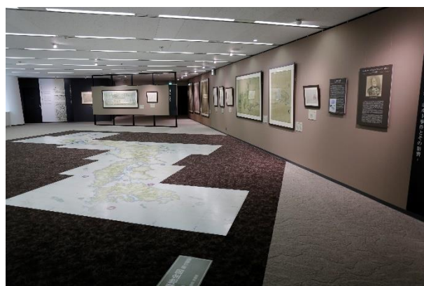
▲第2章 伊能図の出現と近代日本