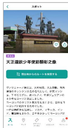
▲②キリシタンの歴史・観光スポット紹介記事イメージ