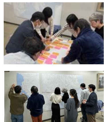
▲③3月9日に開催された大村市メタ観光ワークショップの様子