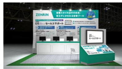
ゼンリンブースイメージ

本新サービスは、2024年4月17日(水)～19日(金)の期間、東京ビッグサイト(東京国際展示場)にて開催される「営業支援EXPO」に出展します。ゼンリンブースでは、「メンバーそのまま、営業スタイルもそのまま変えずにかわれる営業ツール」をコンセプトに、サービス概要や機能の紹介をいたします。