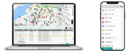
パソコンや、モバイル端末で リアルタイムに情報共有