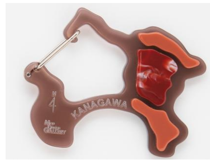
▲赤レンガのデザイン