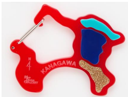
▲中華街のデザイン