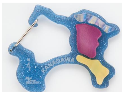
▲みなとみらい夜景のデザイン

「文具女子博 2025」の開催地である横浜の観光地やイメージをモチーフにした限定デザインを3色(みなとみらい夜景、中華街、赤レンガ)販売します。