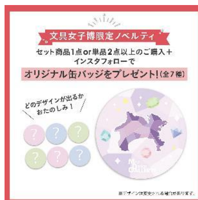
▲プレゼントするオリジナル缶バッジ イメージ

ゼンリンブースにお越しいただき、セット商品1点or単品2点以上のご購入＋公式Instagramをフォローした方に、文具女子博先行発売の「宝石シリーズ」デザインのオリジナル缶バッジをプレゼントします。エリアは関東7都県（東京都、神奈川県、千葉県、埼玉県、栃木県、茨城県、群馬県）からランダムでのお渡しとなります。文具女子博限定ノベルティとなります。