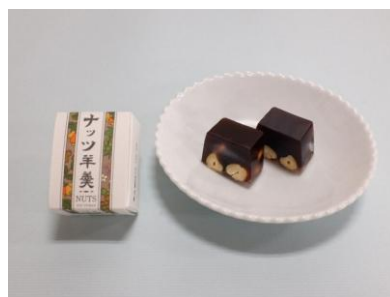
▲村岡総本舗(佐賀県 小城市)「ナッツ小函羊羹」

館内の休憩スペース「Ligare」では、企画展のテーマに関連したメニューを期間限定でご用意しています。本企画展では、明治時代以降の近代化の中で「羊羹の本場」として知られるようになった、佐賀県小城市の「村岡総本舗」の「ナッツ小函羊羹」を販売します。肥前国から現代へと続く悠久の歴史に思いを馳せながら、ひと時の余韻をお楽しみください。