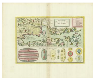
▲「長崎図」 ケンペル ゼンリンミュージアム所蔵