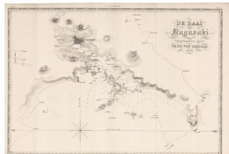
▲「長崎湾図」シーボルト ゼンリンミュージアム 所蔵