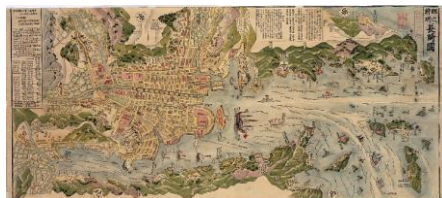
▲「肥前国長崎図」

本企画展では一つの国として海外交流を通じて歴史を重ねてきた佐賀と長崎を紹介します。特に、江戸時代に長崎が外交窓口となり、佐賀藩がその警備を担っていた様子を描いた絵図や、海外に渡った長崎の地図は、“肥前国から世界へ”を象徴する展示です。