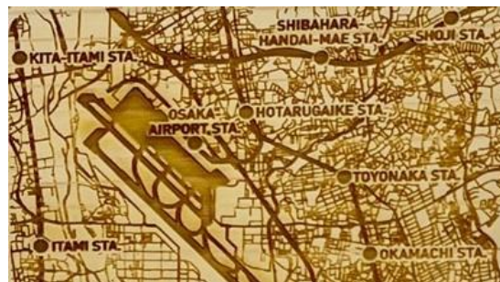
▲マグネット/伊丹空港 スクエアの地図デザイン 主要な駅など詳細な地図が刻印されています