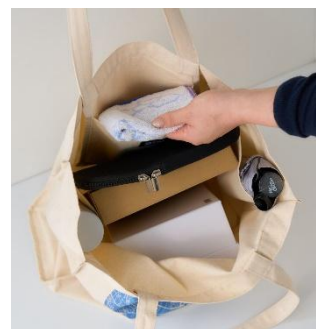
▲内側にはオープンポケットが3つ付いて おり側面のポケットには500mlのペットボ トルや折り畳み傘など収納できます