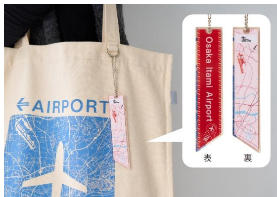
▲POP-UP STORE 限定のクリーム色生成りは フライトタグ風のアクрилチャーム付きです

「空の旅」をイメージし、地形や路線・道路などがわかる伊丹空港周辺の広域地図を、空港を示す方面看板風に表現しています。伊丹空港のデザインは、POP-UP STORE限定のクリーム色生成り(フライトタグ風のアクрилチャーム付き)と、Map Design GALLERYオンラインストアで展開中のダークグレーを販売します。