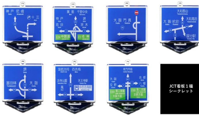
▲(左上から)大阪府大阪市西淀川区、大阪府豊中市、大阪府四条畷市、大阪府柏原市、大阪府松原市、大阪府堺市北区、大阪府枚方市、JCT 看板 1 種シークレット

◆ SNSの声をきっかけに商品化した「都道府県型キーホルダー」/大阪府、兵庫県(全2種) 各¥2,640円(税込) イベント限定の都道府県型キーホルダーを2種類販売します。大阪府は文楽、兵庫県は姫路城がそれぞれカラーモチーフです。