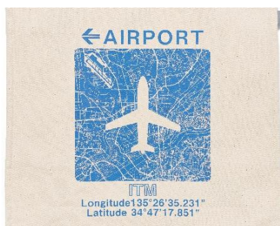
▲方面看板風のデザイン 「ITM」の表記は伊丹空港の3レターコード※ ※国際航空運送協会 (IATA) により定めら れた世界共通のコードです