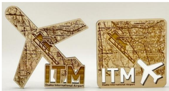
▲(左から) マグネット/伊丹空港 飛行機 ¥1,760(税込)、 マグネット/伊丹空港 スクエア ¥1,540(税込)

国産のヒノキを使用した、良い香りが漂い、日本を感じていただけるシリーズ商品です。ヒノキの木目の美しさと温もりを感じつつ、伊丹空港周辺の詳細地図を刻印したデザインを楽しめます。