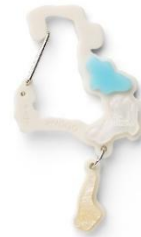
▲姫路城をモチーフにした兵庫県のキーホルダー