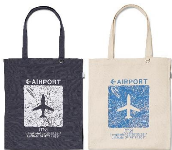
▲トートバッグ ダークグレー/POP-UP 限定の クリーム色生成り