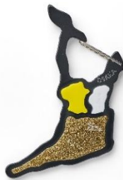
▲文楽をモチーフにした大阪府のキーホルダー

◆ SNSの声をきっかけに商品化した「都道府県型キーホルダー」/大阪府、兵庫県(全2種) 各¥2,640円(税込) イベント限定の都道府県型キーホルダーを2種類販売します。大阪府は文楽、兵庫県は姫路城がそれぞれカラーモチーフです。