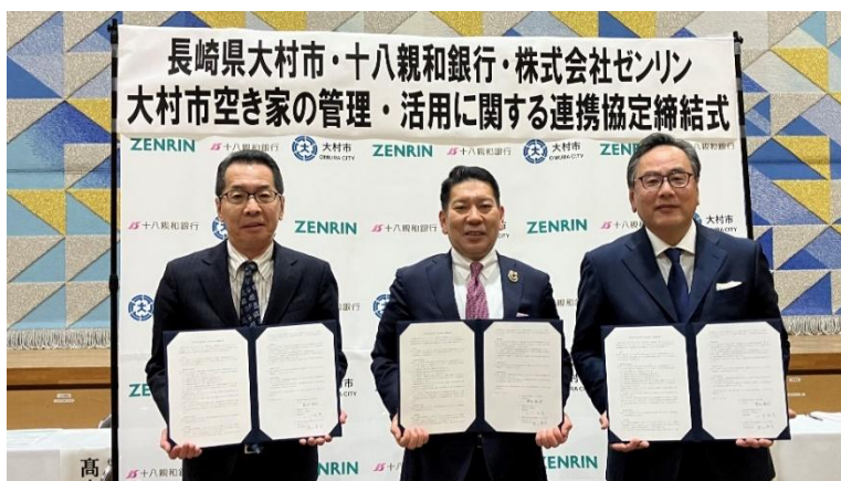
連携協定 締結式の様子

※「大村市空き家マッチングサービス」サービス紹介ページ： https://akiya.zenrin.co.jp/