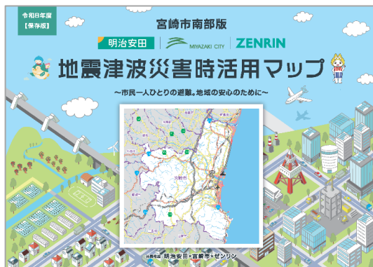
「宮崎市地震津波災害時活用マップ」表紙イメージ

平時からこのマップを活用して備えておくことで、災害時には適切な行動や迅速な避難ができるようになることを目指しています。