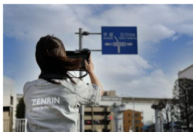
方面案内看板の調査