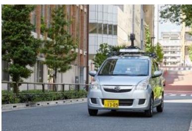
仕様に基づく道路を車両で走行

ゼンリンは、国内カーナビゲーション用の地図データでトップシェアを持ち、独自調査から収集・整備した地図データをナビメーカー等に提供しています。全国に約70か所の調査拠点を保有し、建物の入り口情報や方面案内看板、道路規制情報など、カーナビゲーション機能の向上に貢献する詳細な情報を整備・提供しています。