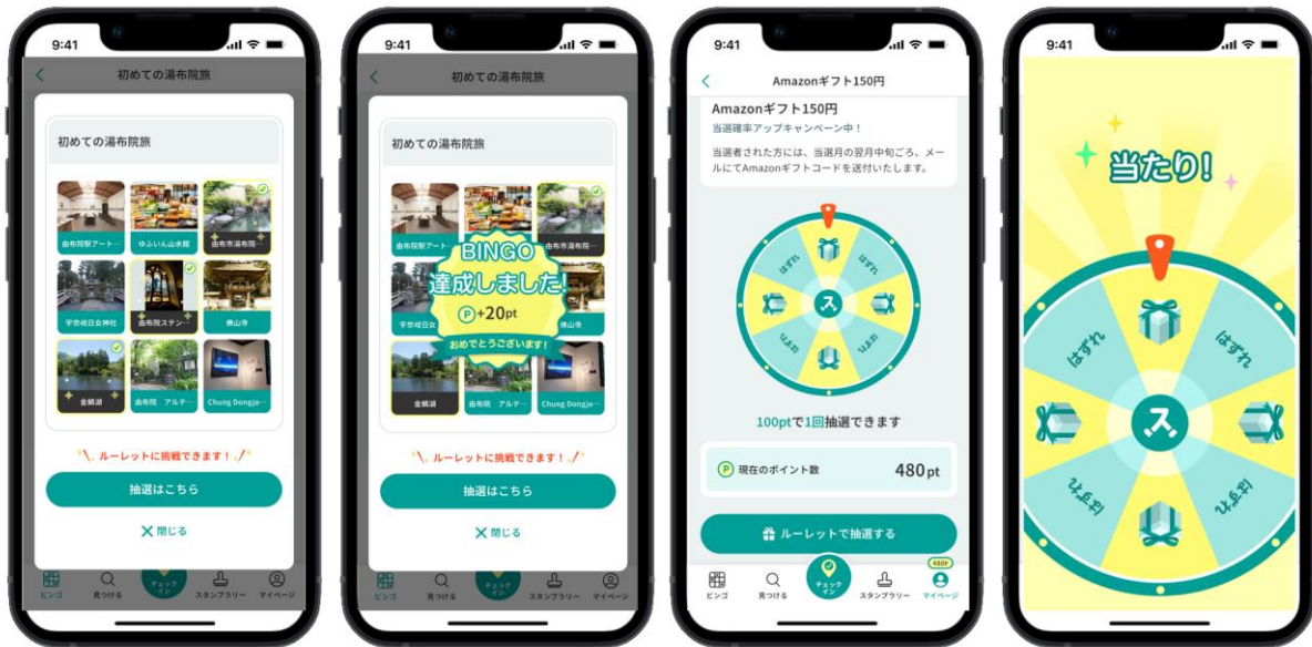
▲「旅ナカ」での登録したスポットへのチェックインと、「旅アト」のプレゼント抽選イメージ