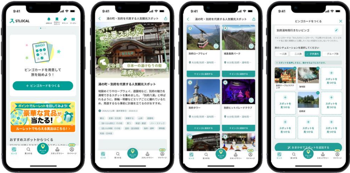
▲「旅マエ」における「ビンゴカード」作成のイメージ