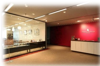
ゼンリンミュージアム 内観

販売開始日：2022年2月22日(火) 利用開始日：2022年3月1日(火) 運営：JR九州ステーションホテル小倉 URL： https://www.station-hotel.com/