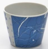
地図柄フリーカップ