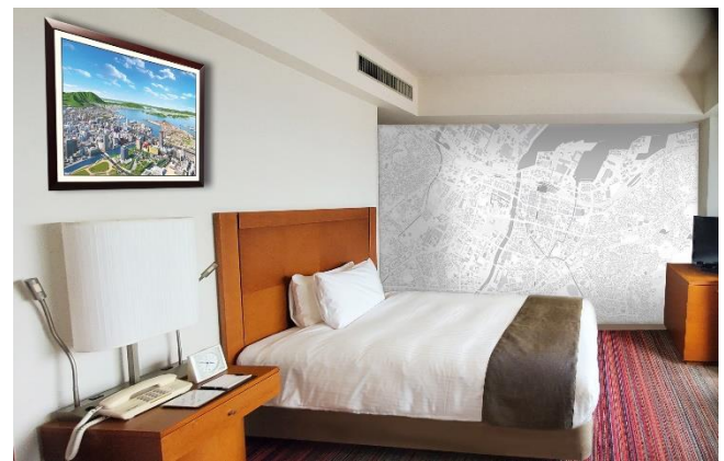
地図さんぽの部屋 イメージ