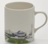
地図柄マグカップ