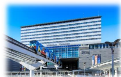
JR九州ステーションホテル小倉 外観

愛称：地図さんぽの部屋 企画：JR九州ステーションホテル小倉株式会社 株式会社ゼンリン 所在：15階 スタンダードツインルーム（1室限定） 期間：2022年3月1日(火)～2023年2月28日(火)