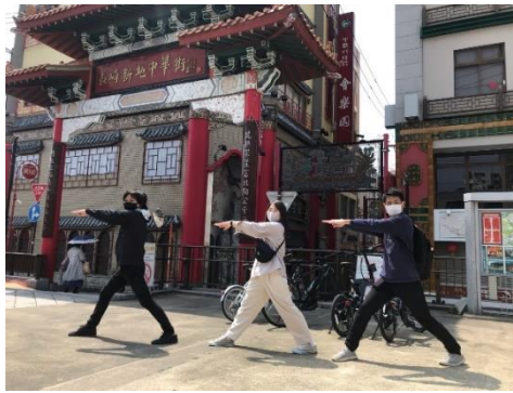
eBike を使ったスタンプラリー企画メンバー

eBike は長崎の観光にもぴったり！まち乗りタイプの eBike で坂道も路地もスイスイと楽しみながらスタンプラリーにチャレンジしてみてくださいね。長崎のもう一步「奥」を探検してみしてほしいです！全コンプリートの方には ROUTE からプレゼントもご用意していますのでお楽しみに！