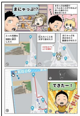
▲ガイドブック「はじめてのまなっぷ」

ガイドブック「はじめてのまなっぷ」・「ミッション」は、子どもたちが理解しやすいよう、キャラクター同士の会話形式で説明を記載しており、子どもたちが自発的に楽しく学べる仕組みとなっています。