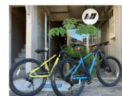
エリア: 五島列島 > 福江 クロスバイクレンタル