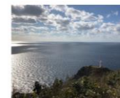
エリア: 五島市 > 福江 大瀬崎トレッキング