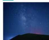
エリア: 五島市 > 福江 星空ガイドツアー