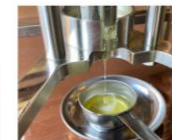
エリア: 五島市 > 福江 椿油、搾油体験