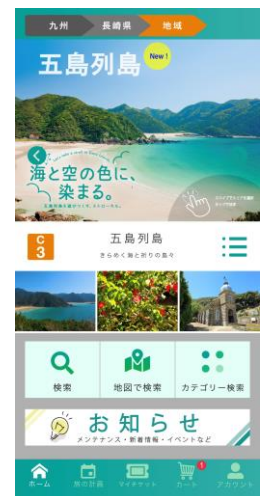
▲スマートフォンアプリ「STLOCAL」

「STLOCAL」は、観光型MaaSの実証実験において提供している観光情報Webサイト、及びスマートフォンアプリのサービスです。“旅するあなたへ、そのまちでのとっておきの過ごし方をご提案する”をコンセプトに、Webサイトでは王道観光ルートから再訪したくなる路地裏などの観光情報を発信しています。また、スマートフォンアプリでは、旅の計画から公共交通・観光施設・体験アクティビティの電子チケットの購入までが可能です。現在、五島エリアの他に長崎市、佐世保・西九州エリアを展開しています。