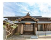
エリア: 五島列島 > 福江 山本二三美術館入館券