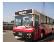
エリア: 五島列島全域 【五島市外在住者限定】1日フリー乗車券

チケット一覧 URL: https://stlocal.net/stlocal-ticket/