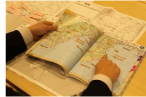
▲マップ事典でプラン作成

マップ事典では、日本全国 1,180ヶ所の道の駅の、位置や営業時間、名物からおススメグルメまで、様々な情報を確認することができます。さらに、AR 機能でマップ事典とナビアプリの連携も可能！訪問する道の駅を考える…道の駅めぐり旅の第一歩です。