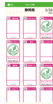
▲チェックイン機能を搭載