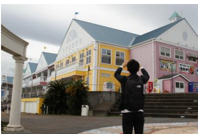
▲旅中に撮った写真はアプリと紐付けすることができます

また、旅中に撮影した写真はアプリに自動保存され、道の駅と紐づけた記録が可能です。自分だけの旅の記録を残すことができます。