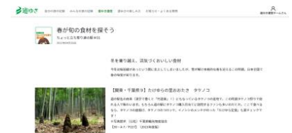
▲「道ゆき通信」掲載記事イメージ

「道ゆき」運営スタッフがお送りする「道ゆき通信」をお楽しみいただけます。新しくできた道の駅の訪問レポートや、季節の話題が盛りだくさん！ぜひご期待ください。