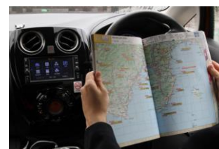
▲ドライブ中 ロードマップをチェック