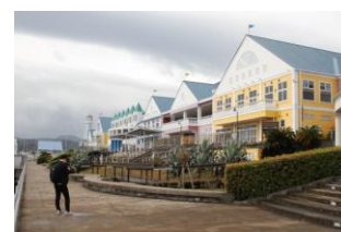
▲「伊東マリンタウン」(静岡県伊東市)

また、“道の駅めぐり旅”を趣味とする“道の駅ファン”は、ゼンリンの調査によるとなんと約34万人…！みなさまに“道の駅めぐり旅”をもっと楽しんでいただくべく、この度「道ゆき」をリリースしました。