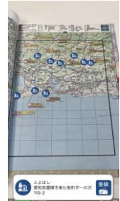
▲AR 機能使用イメージ