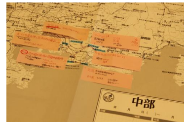
▲付箋を駆使して旅の計画を見える化！

日本全国の道の駅の位置情報を掲載した白地図です。直接塗るもよし！付箋を駆使するもよし！旅前のプランや旅後の記録を自由に書き込めます。