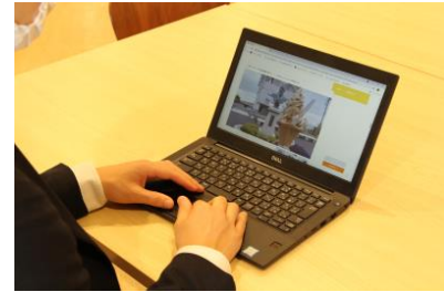
▲Web サービスを利用して旅の思い出を整理

ブラウザで利用可能な Web サービスでは、ナビアプリで取得した記録をもとに、道の駅めぐり旅の思い出を分かりやすくまとめられます。