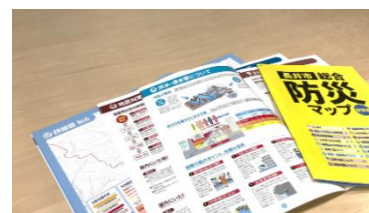
▲ハザードマップのイメージ

自然災害が起こった際の被災想定「範囲」や「規模」を一定の条件で地図上に可視化することにより、平時から災害に対していざというときの適切な行動について考えるきっかけになります。当社は、ハザードマップ制作を通じて住民への周知を支援しています。