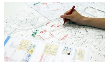
▲ゼンリン自主防災マップのイメージ

まち歩きで見つけた危険箇所を地図上に書き込むことができます。情報の確認・共有ができ、事前に作成したオリジナル地図を見て、避難する際に活用できます。