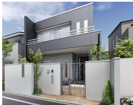
施工イメージ 3型(オールドシルバー)

「シンプルモダン門扉 レジーナ シリーズ」は、スチール製のオーダー品に引けを取らない意匠を持ったアルミ鋳物門扉です。アルミ鋳物ならではのディテールから生み出されるデザインや塗装色のバリエーションなどが、高いグレード感を醸し出し、品格ある外構デザインを創り出します。スチール製のオーダー品に比べ半額程度の価格を実現するなど、高い意匠性とリーズナブルな価格を兼ね備えた商品です。