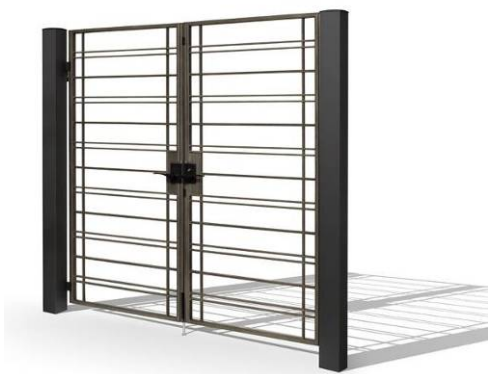
1型(オールドブラック)

直線を基調としたシャープなシルエットに、鋳物ならではの重厚感と繊細な造形にこだわったモダンタイプの鋳物門扉です。防犯面でも安心できるクローズ外構の塀の高さに対応するサイズ設定（高さ：1,400・1,600mm）により、上質感漂う玄関まわりを演出します。