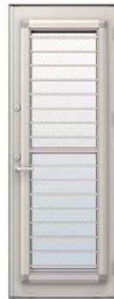
2013 年 5 月発売 <勝手口ドア上げ下げ通風仕様>