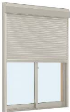
2013 年 4 月発売 <シャッター付引違い窓>