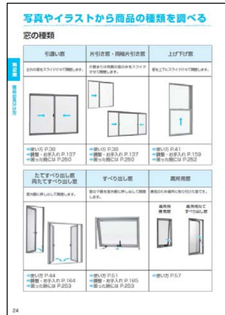
(「商品の見分け方」掲載ページ)

膨大な量の情報を、念入りな分析・整理によりシンプルかつわかりやすくまとめた、まさに「一家に一冊」にふさわしいマニュアルである。