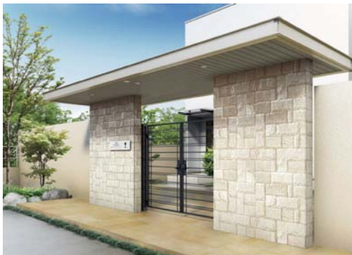
モダンエッジ デザイン

ラグジュアリー感のあるエントランス空間の代表例は、門扉を覆う奥行きのある屋根(アーチ)とそれを支える壁面、及び門扉で構成されています。従来は、高度な湿式(現場でモルタル材などで施工)の施工技術が要求される現場造作物での対応が主でしたが、「XTIARA(エクスティアラ) アーチ」は、工業化製品のアルミ乾式壁構造フレームを採用することで、洗練された屋根デザインや、安心品質と工期の短縮(従来工法では7日程度を要しましたが、半分以下の2.5日間程度に短縮)を実現しています。