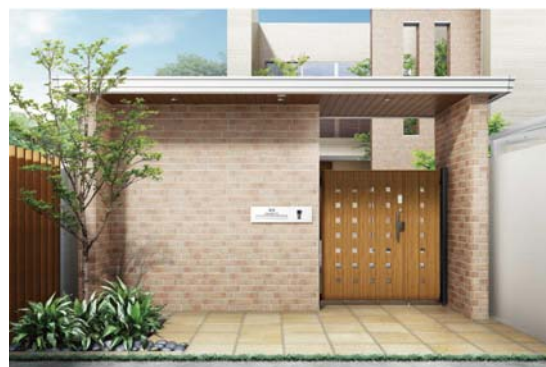
カジュアル デザイン