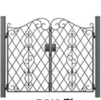
EC02 型 (ラチス)