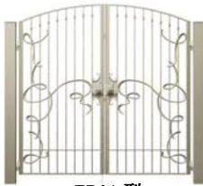
EB01 型 (リボン)