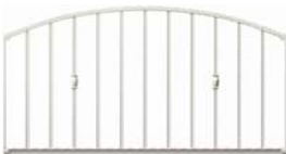
ES08 型 (Rトップ)

門扉の特長な要素を取り入れながらもバランスを考慮し、連続性を意識したデザインを採用。複数個使いでも連結部で流れが途切れず、美しい納まりを実現しています。