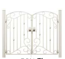
EC01 型 (唐草)