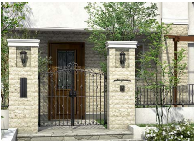
「シャローネ」門扉 EB02 型と フェンス ES09 型