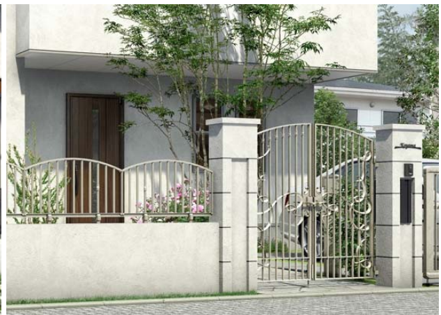
「シャローネ」門扉 EB01 型と フェンス ES08 型