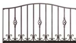
ES09 型 (アーチ)