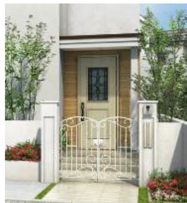
「シャローネ」門扉 EC01 型と スマートドア「ヴェナート」U09 デザイン