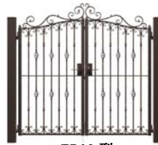
EB02 型 (クラウン)