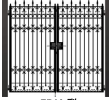
EB03 型 (剣先)