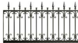
ES10 型 (剣先)