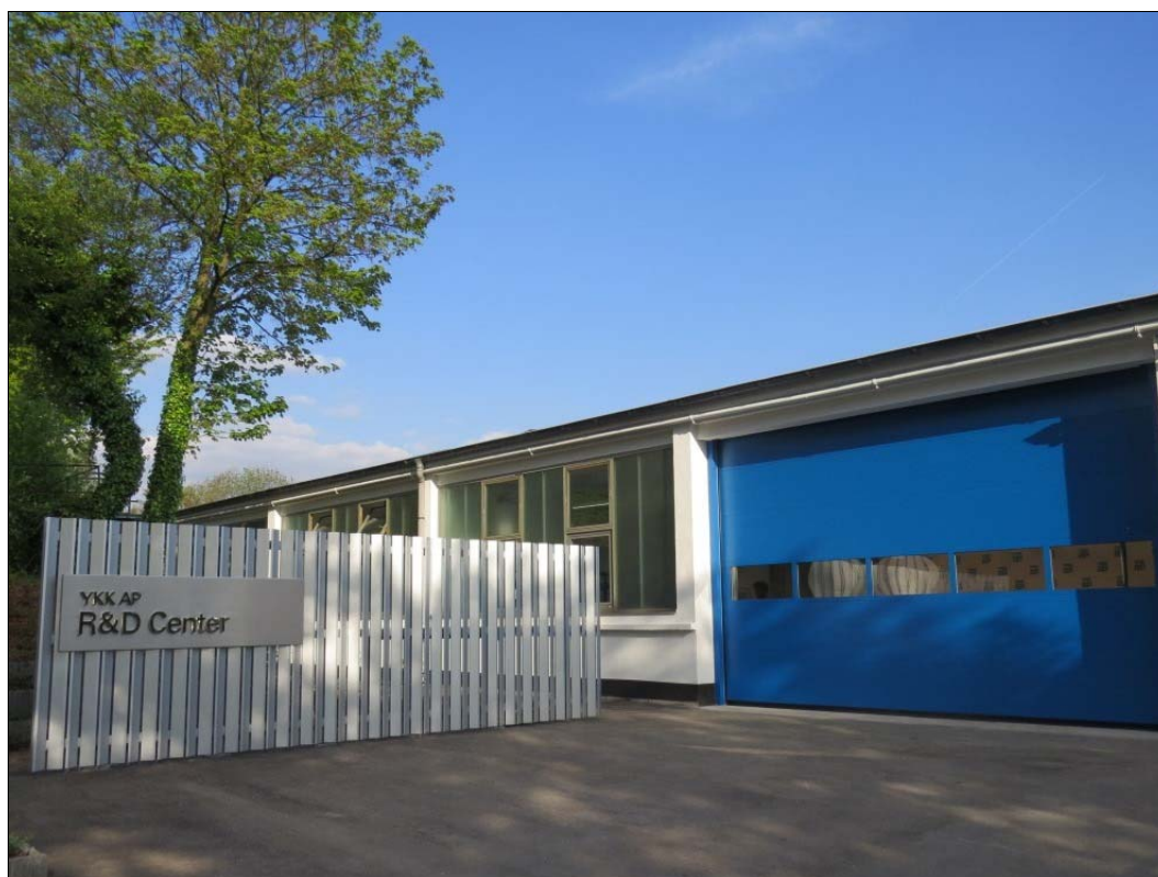
「YKK AP R&D センター（ドイツ）」外観

YKK AP は機能部品や高性能ガラスなど先進技術を有するドイツで、世界中の人々に提案できる窓をグローバルな視点で研究開発していきます。