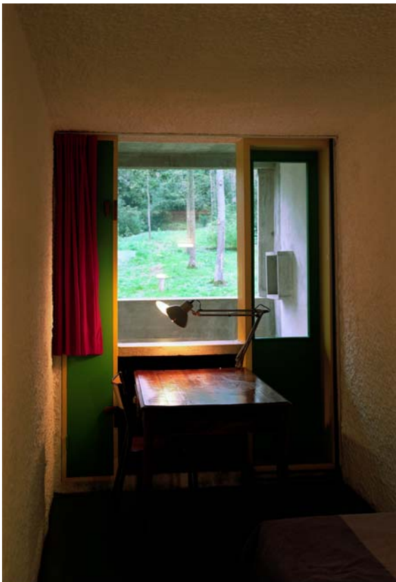
ホンマタカシ < La Tourette Monastery, France > 2017

さらに、窓学 10 周年を機に窓研究所の新拠点として開設した「窓研究所アネックス」が、2017 年 10 月 1 日にオープンします。今後、窓文化の浸透のため、新しいスペースを拠点に幅広い活動を行なっていきます。