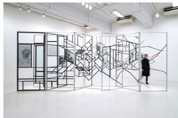
鎌田友介 < D Construction Atlas > 2014

左 ホンマタカシ氏が窓学の一環としてル・コルビュジエの建築の窓をとりおろし、被写体となった窓辺空間の実寸模型をカメラオブスキュラとともに展示。