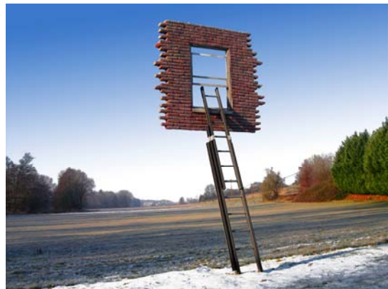
レアンドロ・エルリッヒ < Window and Ladder - Too Late to Ask for Help > 2008