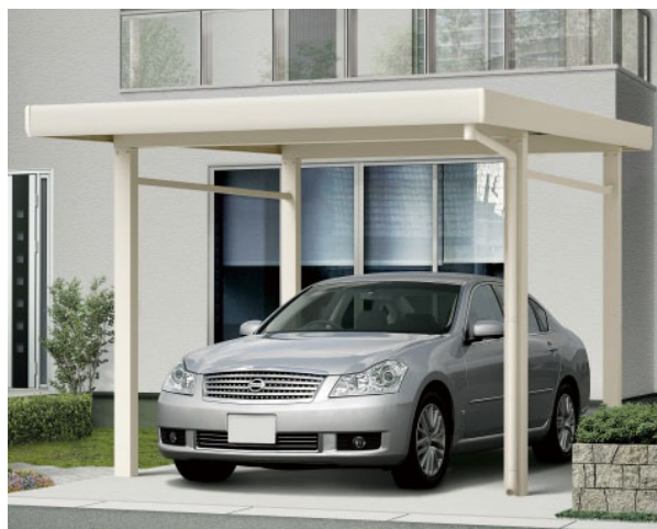
「ジーポート neo」積雪 150 cm 4 本柱仕様 施工イメージ（左）2 台用（右）1 台用

「ジーポート neo」は、柱や梁をはじめとする強固な部材形状と、実物試験による性能検証に裏打ちされた高い耐積雪性能で、愛車をしっかりと守るカーポートです。