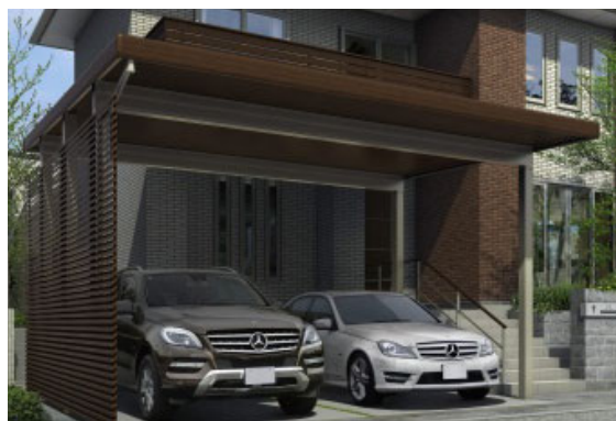
オプション例 (左)サイドパネル (右)スクリーンパネル、軒天パネル