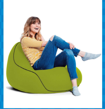
Yogibo Lounger(ヨギボー ラウンジャー)