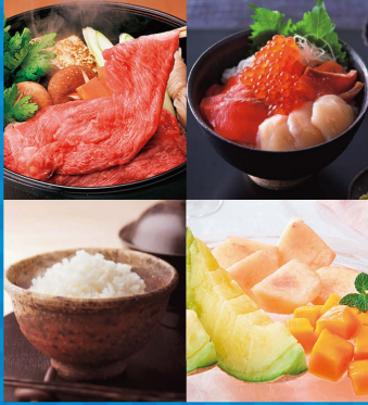
リンベル カタログギフト 美味百撰 李(すもも)