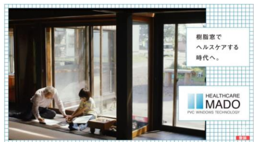
樹脂窓リフォーム体験談動画

断熱性の高い樹脂窓にリフォームすると、冬場の窓の結露が生じにくくなり、アレルギーの原因の一つと考えられるカビ・ダニの発生を抑えることが期待できます。本キャンペーンでは、寒い冬を迎えるにあたり、樹脂窓の効果を体感されたご家族の生の声をお伝えする動画を発信し、動画からクイズを出題。クイズに正解した方の中から抽選で合計40名様に「おうち時間が楽しくなる賞品」をプレゼントいたします。さらに、抽選に外れてしまった方にも、Wチャンスとして抽選で1,000名様に500円相当のデジタルギフトをプレゼントいたします。