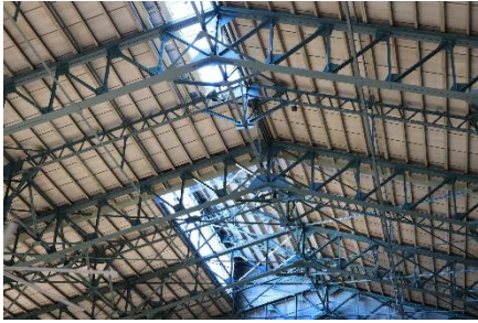
当時の鉄骨トラス屋根を保存