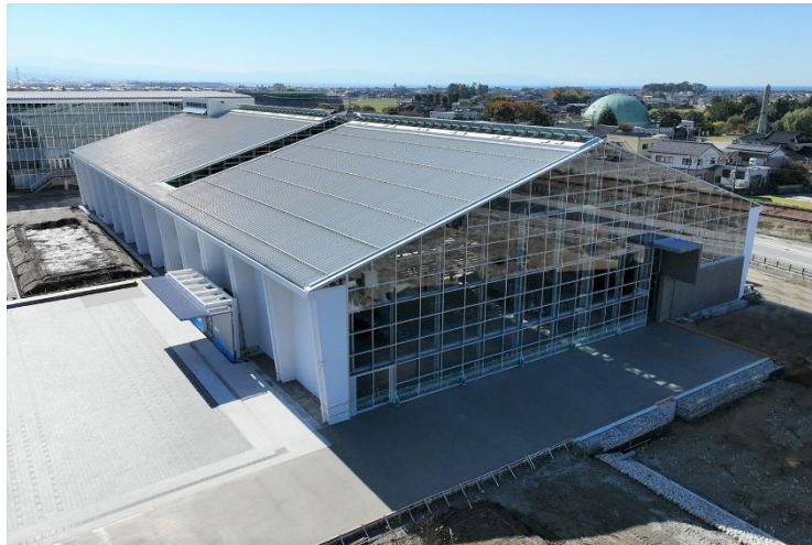
「YKK AP 技術館」外観