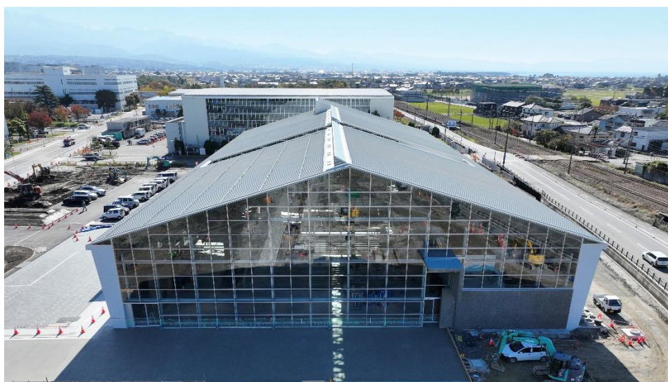
カーテンウォールを全面にした建築