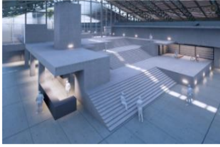
1階 エントランス空間