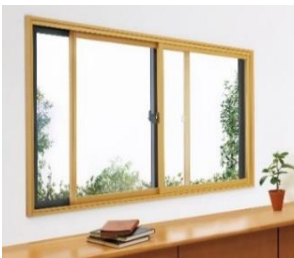
「マドリモ 内窓 プラマードU」