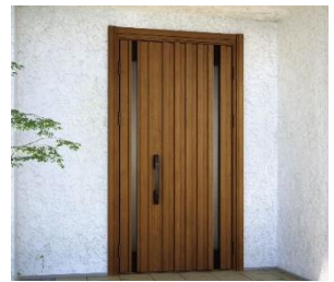
「ドアリモ 玄関ドア」

※窓種やガラス種、デザインや枠バリエーションなどにより、該当しない場合もありますのでご了承ください。