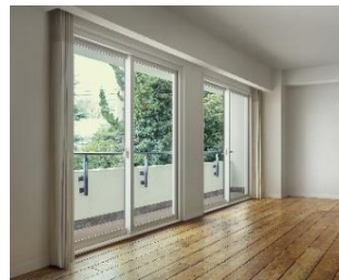
「マドリモ 断熱窓 マンション用」