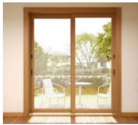
「マドリモ 断熱窓 戸建用」