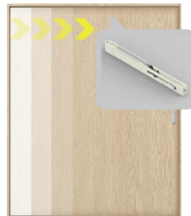
新ソフトクローズ機構でより安定した減速性能に