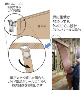
扉の脱落を抑える部品を搭載（ラウンドレールの場合）