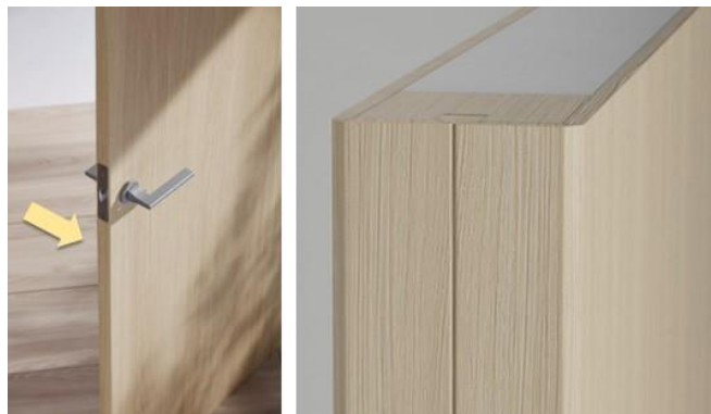
表面の面材を木口まで巻き込むことで、角に継ぎ目が生まれません

扉の端部（木口部分）には木口材を接着させるのが一般的ですが、その仕様では扉の表面と木口部分で色味が若干異なることや、継ぎ目が目立つことが意匠面での課題でした。今回、面材で扉の表面から木口部分まで巻き込む「Vカット製法（※1）」を採用することで、角に継ぎ目のない一体感のある意匠表現が可能となりました。さらに、面材と木口部分が一体化することで経年などにより剥がれる恐れがなくなり耐久性も向上しています。