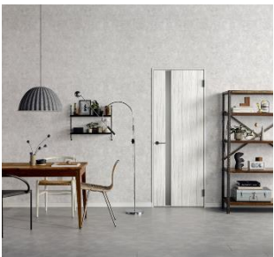
ドアが空間のアクセントになるトレンド（10 色柄）