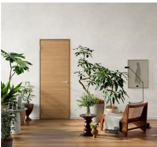
シンプルな扉デザインと相性の良いスタンダード（15 色柄）

また、フローリングのバリエーションも従来比 2 倍の 20 色柄に大幅拡充し、ドアとフローリングの組み合わせで、好きな家具とのコーディネートが楽しめ、自分らしい理想のインテリア空間が実現できます。