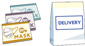
荷物サイズ メール便対応マスク3箱 345×255×95mm

※1：建物正面を指す建築用語。一般的には道路や広場に面した建物の顔となる外観デザインで、建物の雰囲気や景観を決める重要な要素です。