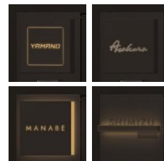
4 デザインの LED 照明表札をラインナップ

シンプルなポストユニット本体のデザインと調和する照明一体型の表札を新たに設定。照明が夜間の視認性を高めながら不審者の侵入を抑止して、防犯性も向上します。テイストの異なる 4 デザインを展開し、玄関まわりの安全性を確保しながらナイトシーンを演出する表札灯の需要の高まりに対応します。