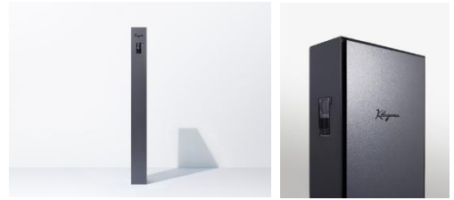
幅 150 mm のスリムさが際立つシンプルな佇まい

水平・垂直基調のスクエアなフォルムが映える、シンプルでスリムなデザインのポストユニットです。建築基準寸法（モジュール）に倣った幅 150 mm、高さ 1,500 mmのプロポーションにより、住宅とエクステリアに一体感と洗練された印象を与えます。