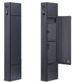
二重扉構造でデザイン性を保ちながら防犯にも配慮

ポスト・宅配ボックスの操作部が外側に露出しないよう、フラットで美しい「二重扉構造」を採用。ポストユニット機能とシンプルな外観のデザイン性を両立させました。ポスト・宅配ボックスを外扉で覆うことで荷受け状況を敷地外から確認されることを防ぎ、防犯にも配慮しています。宅配ボックスは受取頻度が高いとされるネットショッピングなどの小型荷物を想定し、80 サイズ（幅・高さ・奥行の 3 辺の合計が約 80cm）まで対応できるサイズ設計です。