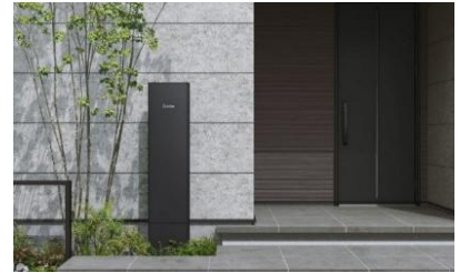
ポストユニット側面を正面にした使用が可能

360 度どの角度から見ても整った形により、ポストユニットの側面（長辺）を住宅の正面に向けて配置することもでき、狭小地や様々なアプローチ構成にも柔軟に対応できます。地面から外扉の下までの高さを約 270 mm に設定し、玄関ポーチの階段脇への設置にも配慮しています。