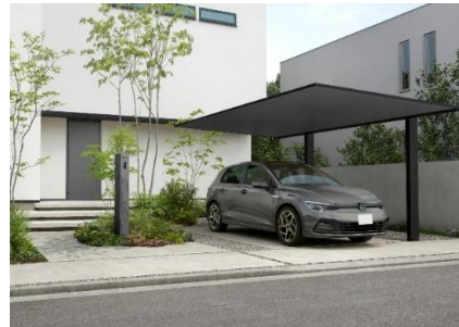
「オルフェス ポストユニット」（左：イメージカット、右：施工イメージ）

現在の新築住宅のトレンドは水平・垂直ラインによるフラットかつシンプルな外観です。このような直線的な住宅デザインは同じく直線的なデザインのカーポートや機能ポールなどの親和性が高く、住まいの顔となるエクステリアの存在感が高まっています。これらの市場背景を踏まえて、エクステリア商品がより一層建物の外観デザインの一部として選ばれるように、シンプルデザインのファサードを演出する「オルフェス (allFace)」シリーズを新たに設定しました。どの角度から見ても (all) 美しく整った住宅の顔 (Face) となるシリーズとして、①水平・垂直基調でバランスの良いプロポーション②余計な線や凹凸のない美しいディテール③質感の高いカラー・仕上げを共通のコンセプトにしています。