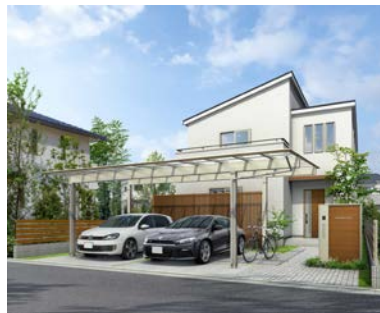
2台用の 「エフルージュ ツインプラス」 活用例：車庫+アプローチ