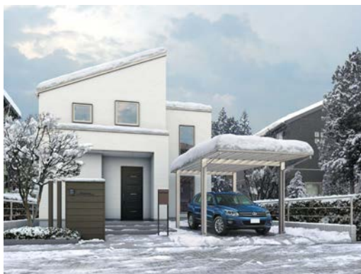
1 台用の「エフルージュ ワン50」