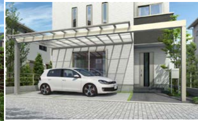
活用例：小型車用のカーポート