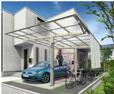
1台用の「エフルージュ プラス」 活用例：車庫+駐輪場

屋根を延長することにより“ 車庫+αの空間 ”を確保した新たなカーポートです。駐輪場やアプローチ屋根のニーズや、住宅の顔となる外構プランにこだわりたいというニーズに応えます。