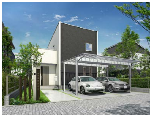
2 台用の「エフルージュ ツイン50」