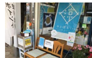
MADOショップ鳥取中央店 2015年取り組み事例