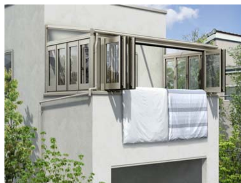
「サンフィール」III 3方折りたたみ戸 施工例