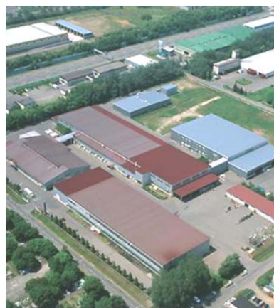
「APW430」の生産工場 YKK AP 北海道工場（北海道石狩市新港南）