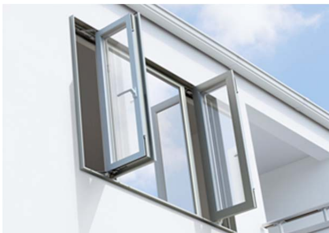
「北のブランド2017」奨励賞を受賞した「APW430」

YKK AP株式会社 北海道支社は、このたび、札幌商工会議所認証「北のブランド2017」において、高性能トリプルガラス樹脂窓「APW430」が2年連続で認証されましたので、お知らせします。また今年も、前年比の売上高の伸び率が特に著しい製品が選ばれた「北のブランド2017」奨励賞も受賞しました。