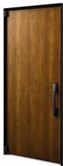
「InnoBest D50」 アルミ樹脂複合枠仕様 （110デザイン）