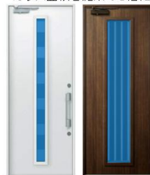
「デュガード」04デザイン 「D50防火ドア」104デザイン