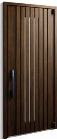
「InnoBest D50 防火ドア」 （104デザイン）

これらのバリエーション充実により、APW樹脂窓シリーズとあわせて住宅のすべての開口部で高断熱化の提案を、更に推進します。