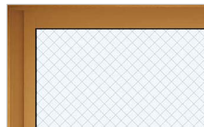
これまでの防火窓（透明網入複層ガラス）