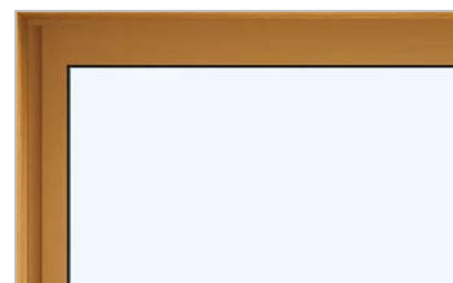
これからの防火窓（透明耐熱強化複層ガラス）